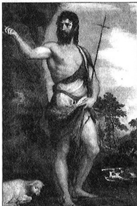
Тициан. Св. Иоанн Креститель. 1542 г.

Аскеза как духовная война направлена не против органической жизни человека, но против тех исходящих от сил тьмы демонических отклонений и извращений, которые на ее почве могут произрасти. Подавляя плотские