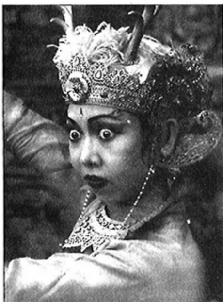
Девушка в индонезийском национальном костюме, исполняющая танец «Киянг»

Христианская антропология . В современном мире христианской антропологией называют христианское учение о человеке. Основания этого учения заложены в Священном Писании, свидетельствующем о том, что Бог, сотворив человека по Своему образу и подобию, изначально вознес его над всеми живыми существами. Человек не просто выше других существ — он